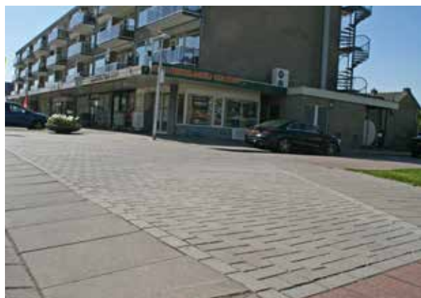
Waddinxveen Mobo betonstraatstenen 21x10,5x8 cm grijs