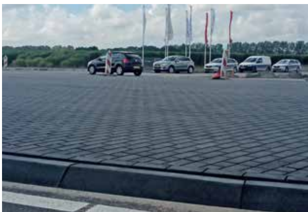
Schiphol Trade Park Voegmortelstenen 21x10,5x8 cm antraciet