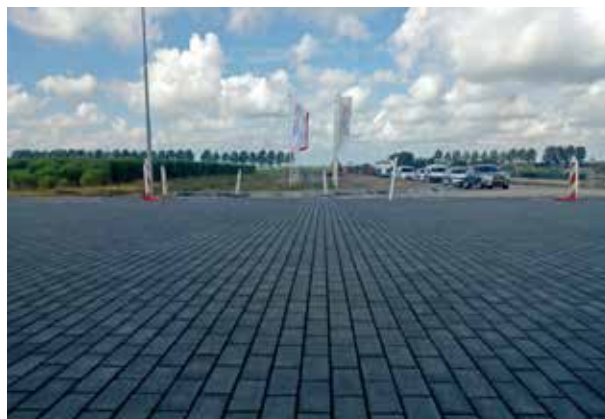
Schiphol Trade Park Voegmortelstenen 21x10,5x8 cm antraciet