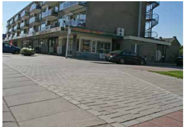
Waddinxveen Mobo betonstraatstenen 21x10,5x8 cm grijs