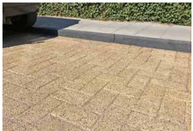
Bloemendaal Mobo betonstraatstenen 21x10,5x8 cm merida geel en betontegels 30x30x8 cm grijs