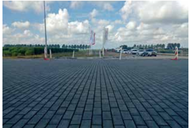
Schiphol Trade Park Voegmortelstenen 21x10,5x8 cm antraciet