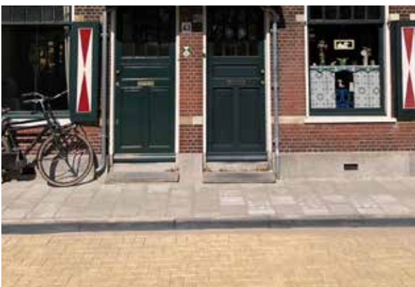
Bloemendaal Mobo betonstraatstenen 21x10,5x8 cm merida geel en betontegels 30x30x8 cm grijs