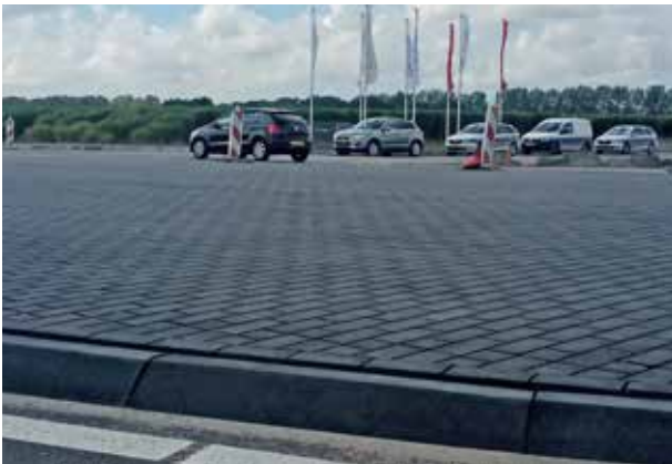
Schiphol Trade Park Voegmortelstenen 21x10,5x8 cm antraciet