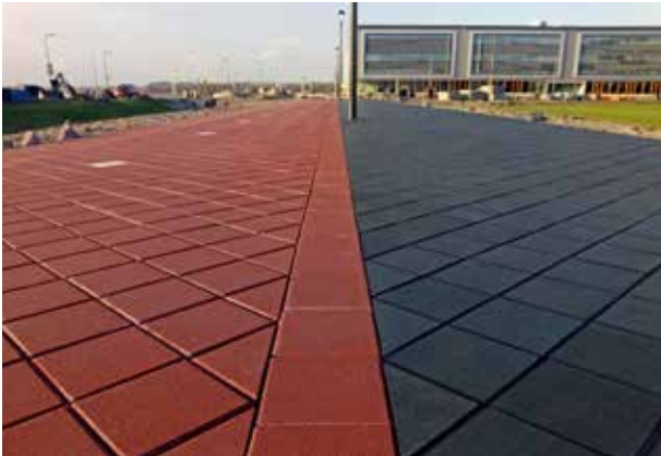
Schiphol Trade Park Betontegels 30x30x7 cm rood en betontegels 30x30x4,5 cm zwart

Morssinkhof Infra heeft diverse Bio Bound producten geleverd voor onder andere de onderstaande werken.